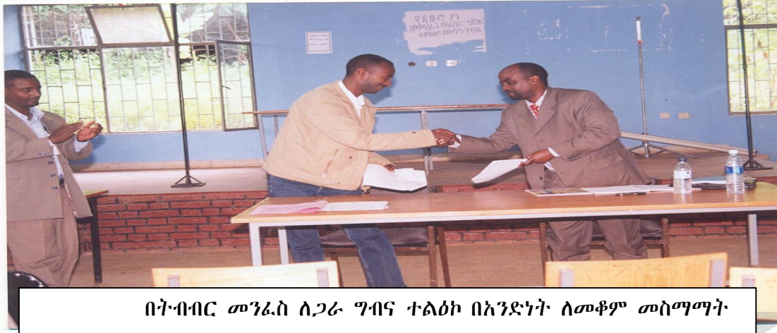
በትብብር መንፈስ ለጋራ ግብና ተልዕኮ በአንድነት ለመቆም መስማማት

በአጠቃላይ በዞናችን የማስፈጸም ስቅም ግንባታ ስትፈቱጂና ፕሮግራሞችን ተግባራዊ ለማድረግ ትክክለኛ ስቅጣጫ ይዘን ስየተገዝን ሲሆን ፕሮግራሞቹ ረጅም ጊዜ የሚጠይቁና ተከታታይነት ባለው ሁኔታ መፈጸም ያስባቸው መሆኑ ግንዛቤ ተይዞ በየደረጃው የሰላማዊነት ሰው ስንዲመጣና የተጀመረ የሰላም ስራዎች ሰውነቶች ይበልጥ ስንዲጠናከሩ የተሰደደ የህብረተሰብ ክፍሎችና ባለድርሻ ሰላማዊ ፍብርብ ፤ ስንዲሁም በየስርዓቱ የሚገኘው የተከበረው ምክር ቤት ሰላማዊ ድጋፍና ከተሰጠ ወሳኝነት ይኖረዋል፡፡