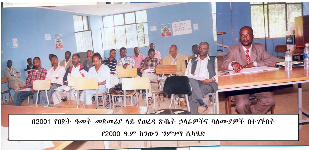
በ2001 የበጀት ዓመት መጀመሪያ ላይ የወረዳ ጽ/ቤት ኃላፊዎችና ባለሙያዎች በተገኙበት የ2000 ዓ.ም ክንውን ግምገማ ሲካሄድ