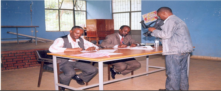
የ2001 ዓ.ም በጆት ዓመት የግብ ስኬት ስምምነት ከወረዳ ጽ/ቤት ጋላፊዎች ጋር ሲፈራረሙ