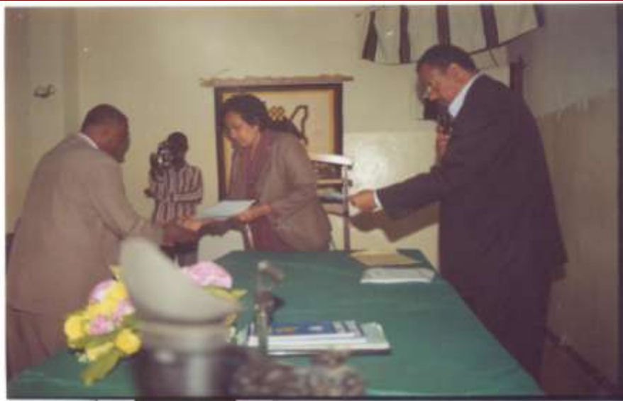
የምስክር ወረቀት አሰጣጥ ሥነ-ሥርዓት

አስተያየቶችን እንደ ግብዓት በመውሰድ በቀጣይ በምናደርገው ውይይት መመሪያዎችን በመፈተሽ ማሻሻያ የምናደርግበት ሁኔታ ይኖራል ሲሉ ገልፀዋል።