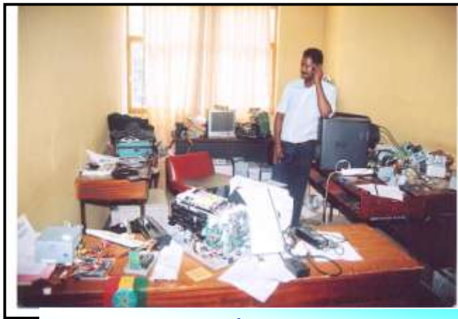
የኢኮቴ የሥራ ሂደት የጥገና ባለሙያዎች በሥራ ላይ

እንደ ስራ ሂደቱ ባለቤት ገለፃ በታክስ አስተዳደር ቢሮ የተከናወነው የኔትወርክ ዝርጋታ ተገልጋዮች ወደ ክልል ቢሮ ታክስ ለመክፈል በመምጣት ይደርስባቸው የነበረው ለአላስፈላጊ ወጪና ጊዜ ብክነት በመከላከል እዚያው ባሉበት ሆነው ክፍያ በማከናወናቸው ወጪና ጊዜ ሙሉ በሙሉ ማስቀረት ተችሏል ። ከዚህም በላይ የስራ ሂደቱ የጥገና ባለሙያዎች በክል ከባድ ጥገና የሚፈልጉትን ጥገናዎች በስራ ሂደቱ የጥገና ክፍል በመምጣት የሚጠግኑ ሲሆን በአንዳንድ ቦታዎችም በአካል በመገኘት የጥገና ስራ እንደሚያከናውኑ ታውቋል።