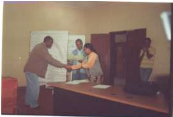
የምስክር ወረቀት አሰጣጥ ስነ ስርዓት

አያይዘውም የስልጠናው ዓላማ ውስጣዊ አቅም ግንባታ ሲሆን በፎካል ስራዎች እንደልምድ አዋላጅ ከሳይንስ ቤት በሚሰራ በመሆኑ ይህንን ችግር በተወሰነ በረቀቀ ለመቅረብ ለየት ባለ መልኩ ከተግባር በር ተጠቅሞ በተሰጠ ስልጠና በመሆኑ የሠራተኛውን አቅም የገነባ ነው ሲሉ ገልፀዋል ።